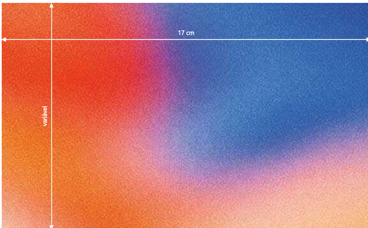
Figura 1. Figuras até 17 cm

Nota: incluir explicação caso necessário.